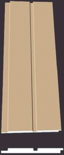
SD 110 50 x 4 x 200 cm