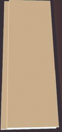
SD 120 50 x 4 x 200 cm