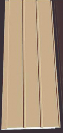
SD 160 50 x 4 x 200 cm