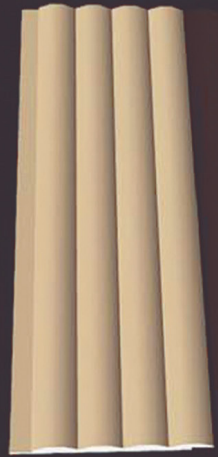
SD 150 50 x 4 x 200 cm