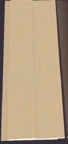
SD 140 50 x 4 x 200 cm