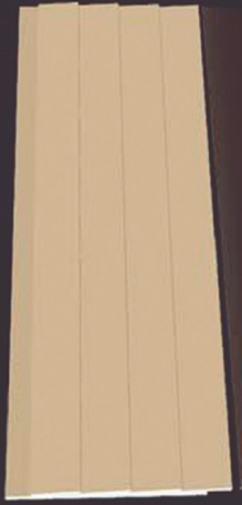
SD 130 50 x 4 x 200 cm