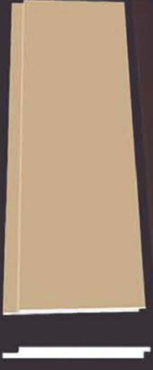
SD 120 50 x 4 x 200 cm