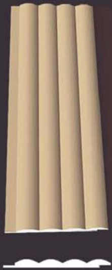
SD 150 50 x 4 x 200 cm