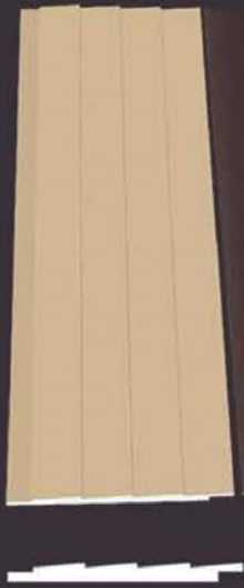
SD 130 50 x 4 x 200 cm