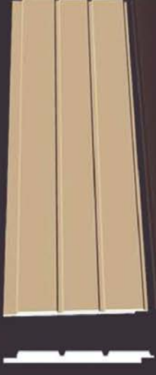
SD 160 50 x 4 x 200 cm