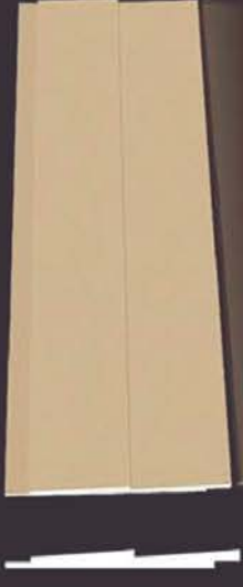
SD 140 50 x 4 x 200 cm